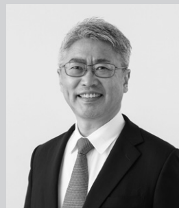
一般社団法人 全国スーパーマーケット協会 常任理事 改善活動普及委員会 委員長